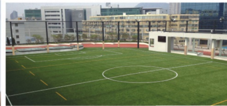
Kellett School Skypitch Sports Ground, Kowloon Bay, KLN