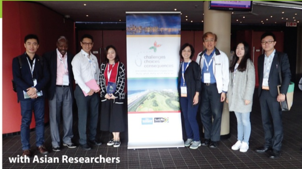
with Asian Researchers

The theme of the Congress is “CHALLENGES, CHOICES AND CONSEQUENCES”. Through the main theme, the Congress established an