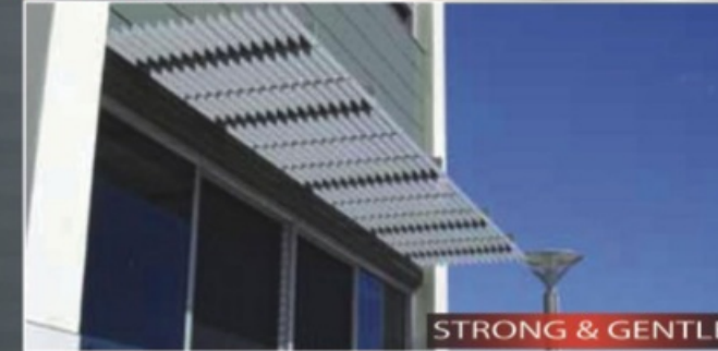
STRONG & GENTLE