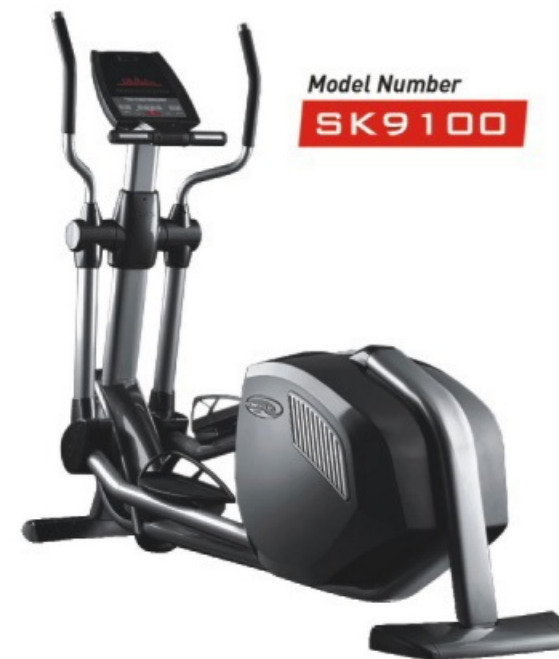
Model Number SK9100

Launched new Experience Series™ cardio equipment and Preva™ networked fitness