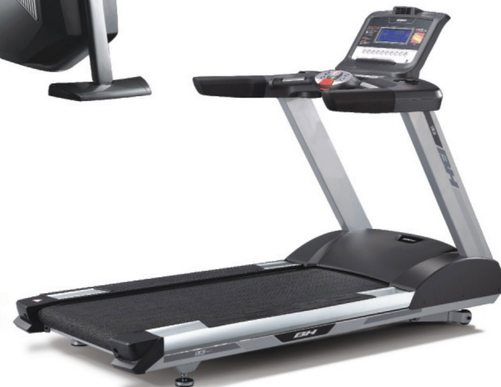
Model Number G6820A