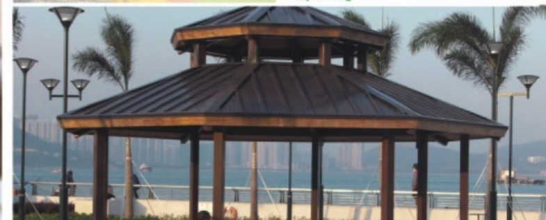
Fu Hong Street Sitting Out Area, Siu Sai Wan, HK