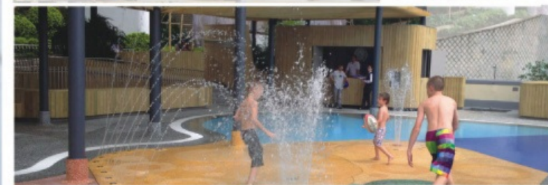
The Repulse Bay "Waterscape", Island South, HK