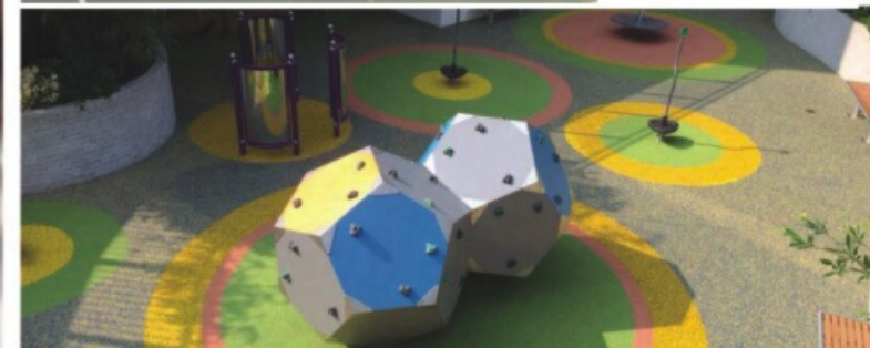
The Repulse Bay "Play Street", 101 Repulse Bay Road, HK