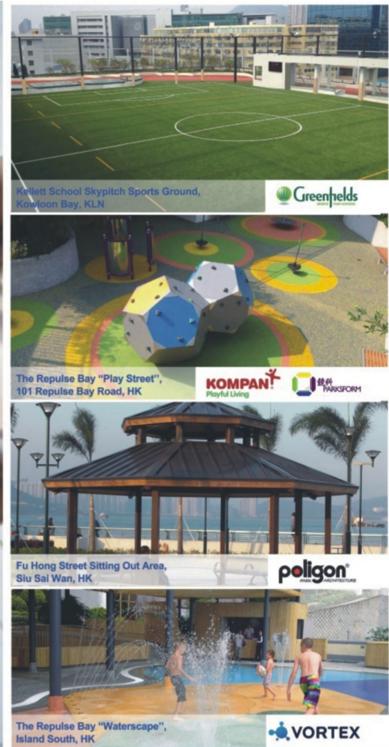
Kellett School Skypitch Sports Ground, Kowloon Bay, KLN Greenfields